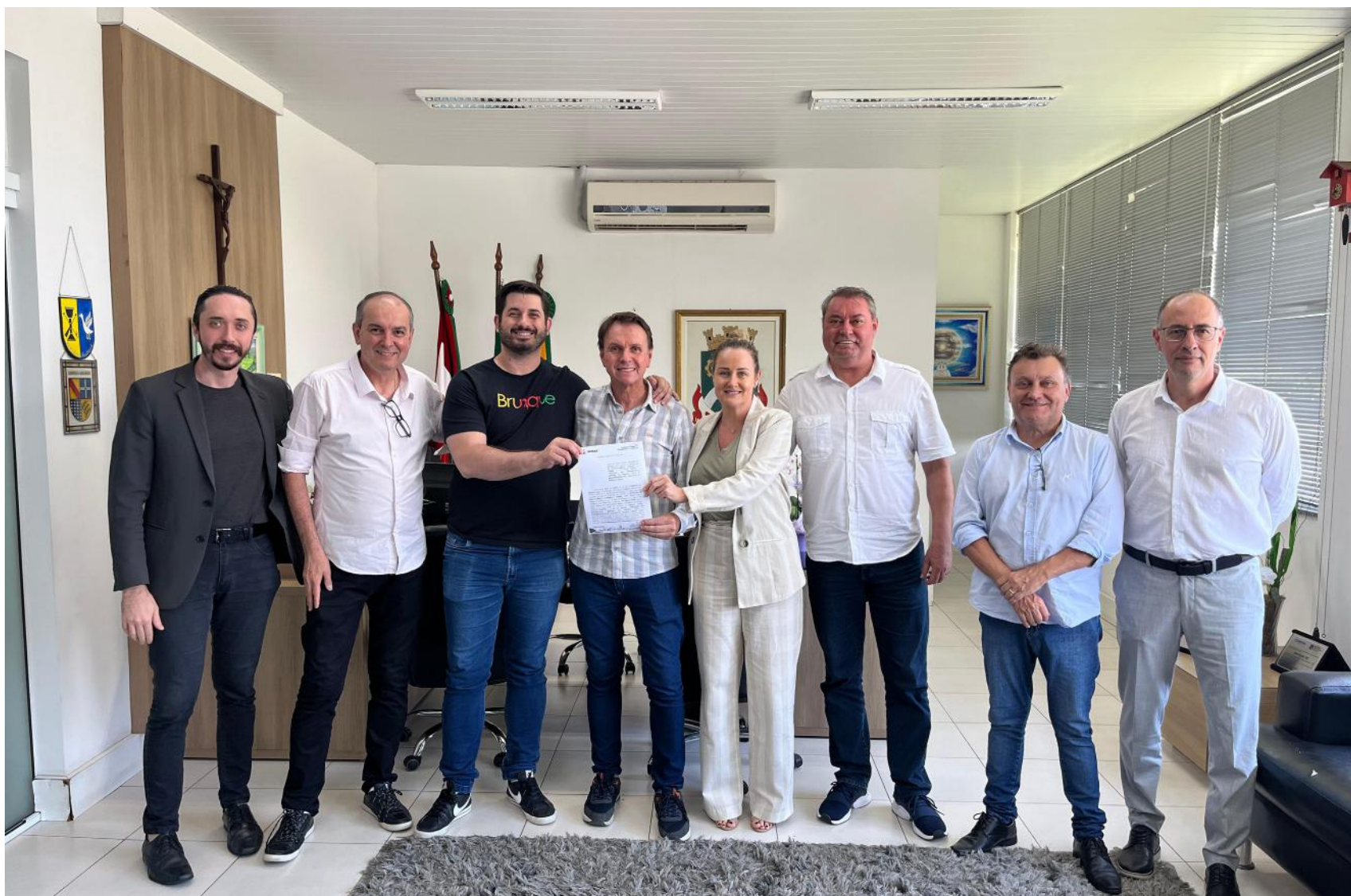
A parceria entre a AmpeBr e a Prefeitura de Brusque com o projeto é válida até 30 de novembro de 2024