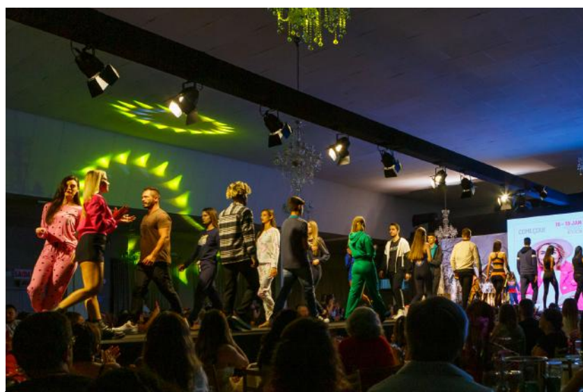
O tradicional desfile da Pronegório acontece no dia 16 de janeiro, terça-feira, e deve contar com a participação de 500 pessoas