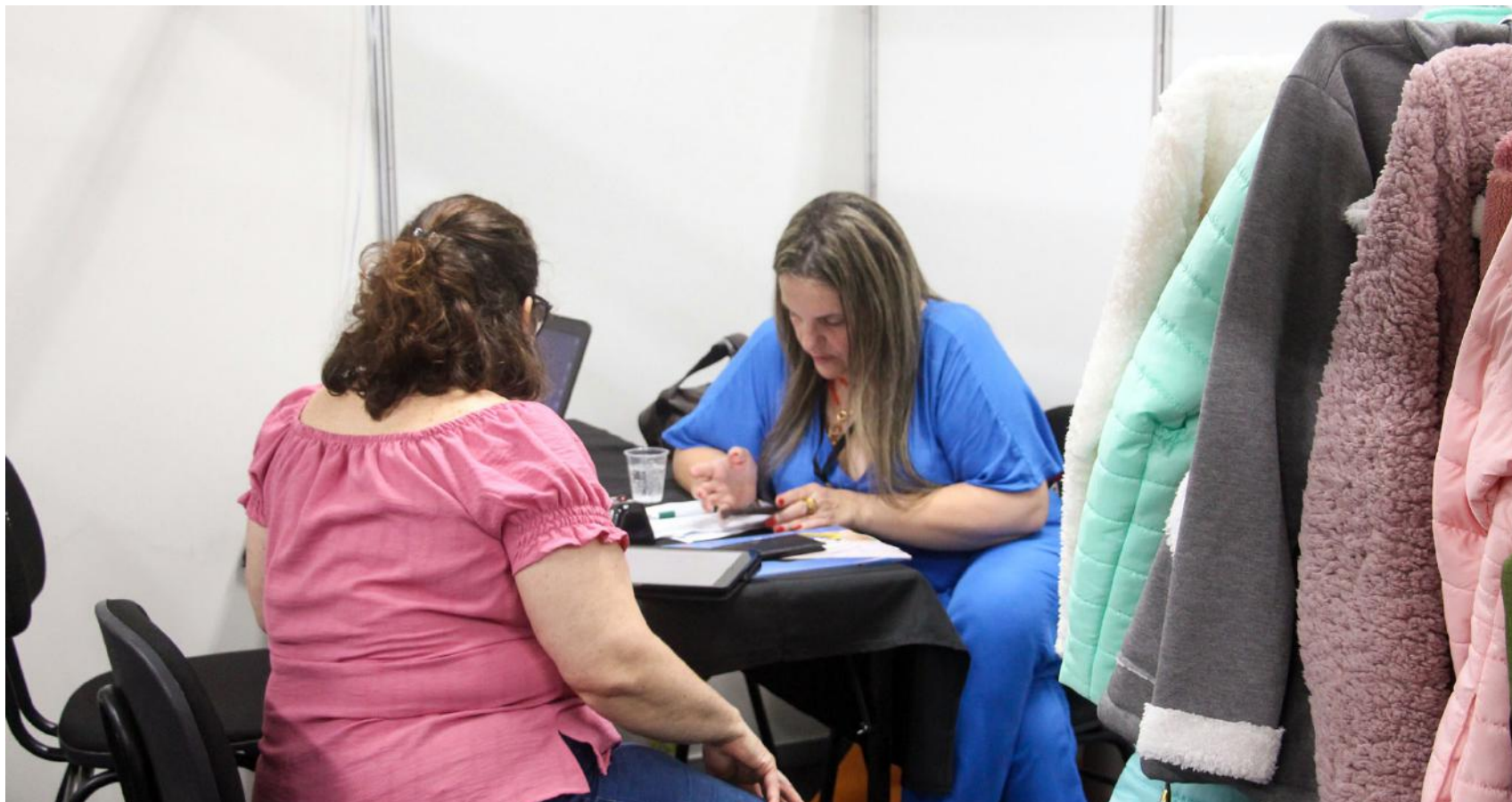
O evento reúne 152 segmentos de empresas fabricantes de Santa Catarina

espera, algo que fazia muitos anos que não ocorria. A diretoria se empenhou muito para realizar uma grande Pronegório em 2024".